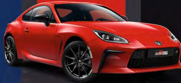
DCK Ignition Red*