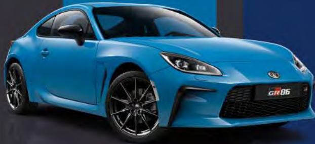
DAR Bright Blue*