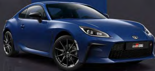
WCH Sapphire blue Metallic