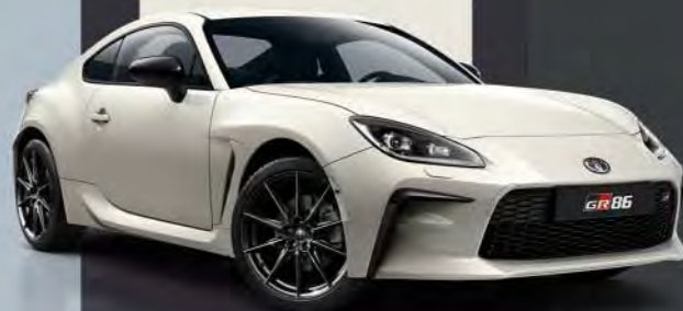
K1X Crystal Pearlwhite Metallic*