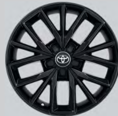
17" Leichtmetallfelgen schwarz (5 Tripplspeichen)