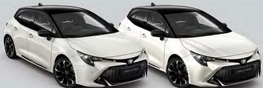
2PU Platinum Pearlwhite Met. 2 / Night Sky Black Met.*