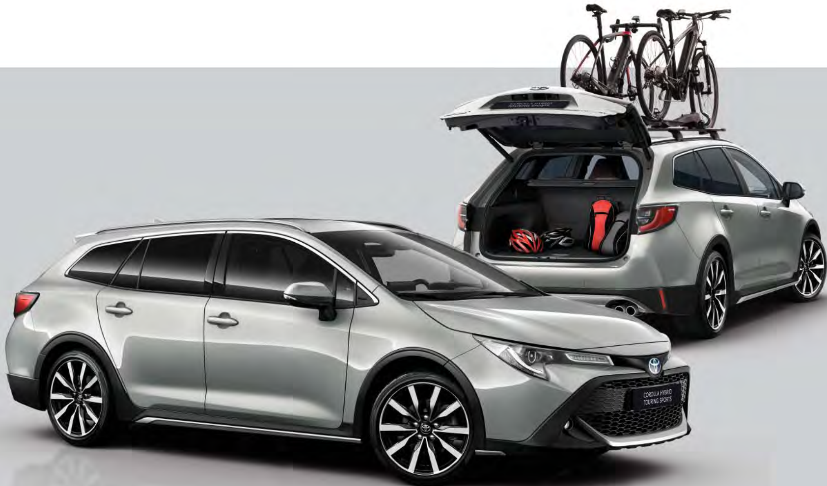
Abbildungen zeigen Symbolfotos.