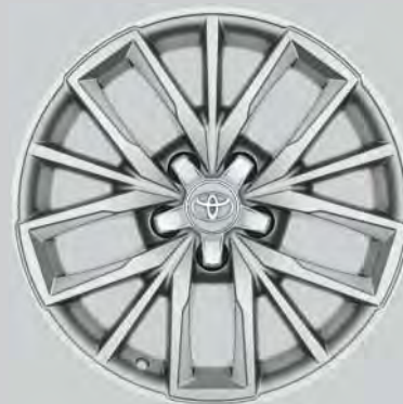
17" Leichtmetallfelgen silber (5 Tripplspeichen)