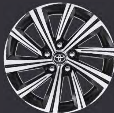
17" Leichtmetallfelge schwarz, gefräst (10 Speichen) Standard für Design