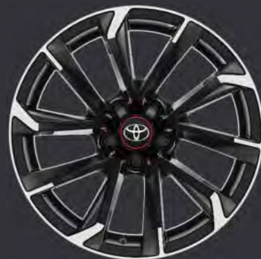
18" Leichtmetallfelge Bi-tone schwarz, gefräst (5 Doppelspeichen) Standard für GR-Sport