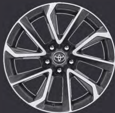
18" Leichtmetallfelge grau, gefräst (5 Doppelspeichen) Standard für Lounge