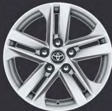
16" Leichtmetallfelge (5 Doppelspeichen) Standard für Active