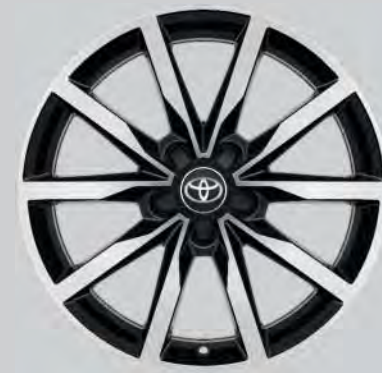
18" Leichtmetallfelgen schwarz, gefräst (5 Doppelspeichen)