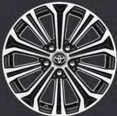
17" Leichtmetallfelge schwarz, gefräst (10 Speichen) Standard für Active Drive