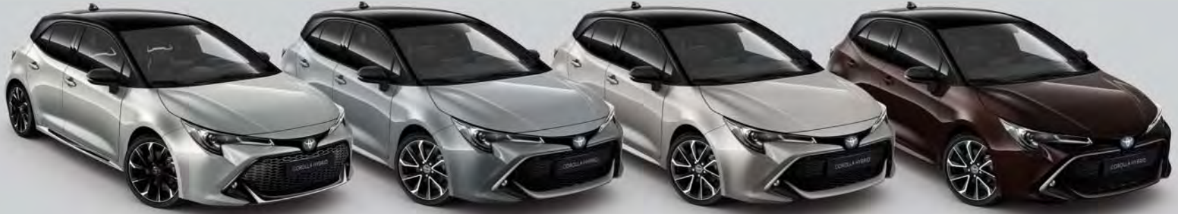
2TX Shimmering Silver Met. 2 / Night Sky Black Met.*