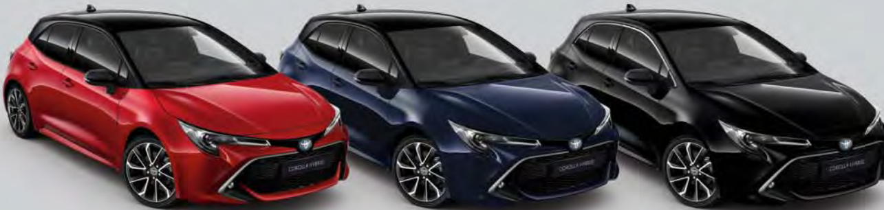
2SZ Emotional Red Met. 2 / Night Sky Black Met.*