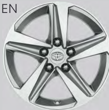
16" Leichtmetallfelgen silber (5 Speichen)