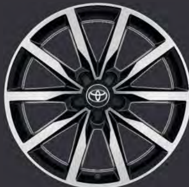
18" Leichtmetallfelge schwarz, gefräst (5 Doppelspeichen) Standard für TREK