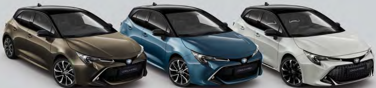
2RF Oxide Bronze Met. 2 / Night Sky Black Met.* 3